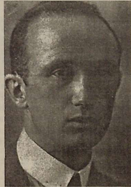
El pintor Elias Salaberria

Más de una vez, le he visto terminar mas de una obra, dar los últimos detalles en una cabeza... quedar contento, satisfecho... Pues bien, igual al día siguiente, veía algo que no le gustaba, y solía decir, "¿cómo es posible que ésto me haya podido gustar a mí?... " y, lo