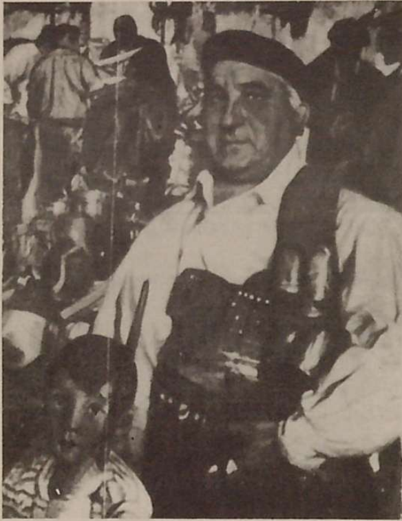
"Lezoko feritan". Cuadro de Elias Salaberria

de Alava en Gasteiz, es un cuadro de la familia, y un hombre con sombrero que está entre sus hermanos, está el, el único autorretrato es ese.