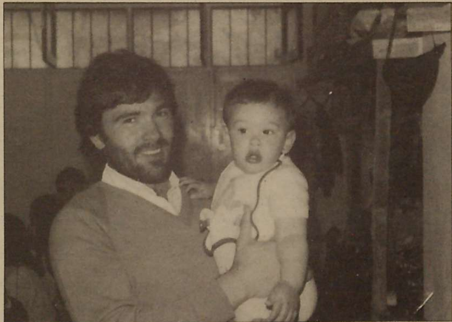
Etxea utzi eta hamar urte zapaltzaileen atzaparretan.