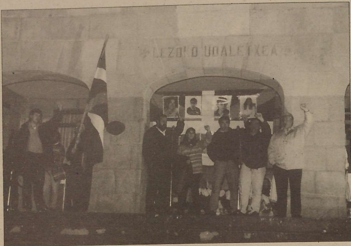
Hamar urte barruan eta etxera herria zain!

pentsatzen dute egunak eta orduak nola bete. Zenbat lo egin, kirola, gorputza nekatu, erlajazio lasaitzeko, pasiatu atzera eta aurrera, irakurri, ondoko zeldakoekin altu hitz egin, eta abar. Esandakoaren antzekoak izaten dira txapeoak, eguna joan eguna etorri berdin; eta bat nola ez dena egiten da.