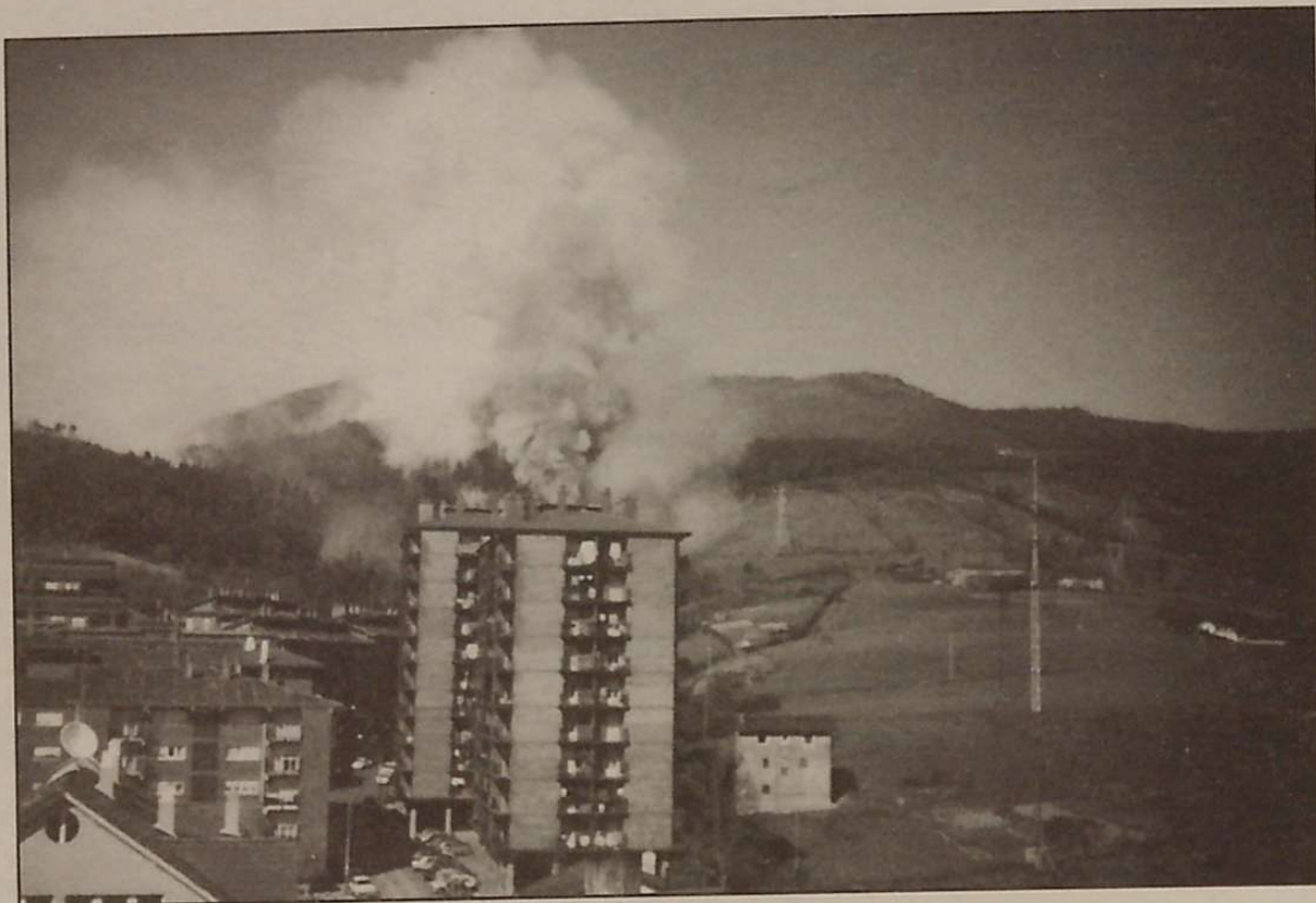
Jaizkibel behin eta berriro erre dute.

Militarrak alde egitea ongi ikusten da mendi zati hori herriarentzat berreskuratuz.