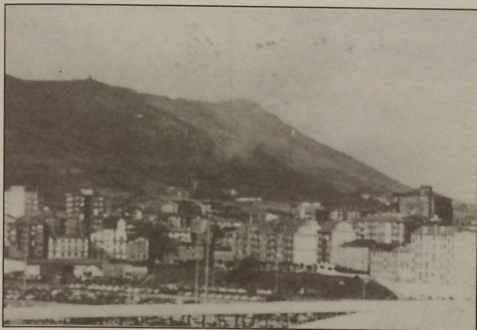
Lezo Jaizkibelen kumea da.

“En la parte alta de cumbres y laderas el uso dominante será el ganadero y el forestal. Los planes priorizarán la detención de los procesos de erosión, plantación de arboleda autóctona o de tipo atlántico y protección de esta zona con cercados”. “Las pistas tendrán un uso acorde con la EXPLOTACIÓN autorizándose el paseo peatonal y en casos especiales el paseo ciclista, con algún punto de mirador e instalaciones anti-incendio”.