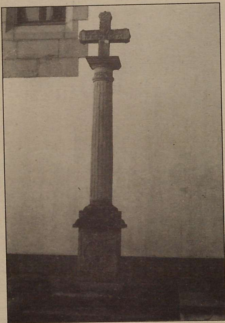
3 IRUDIA: Hendaiako gurutzea.

Honela ulertzen du Barandiaranek —eta iritziz aldatu zuenaren berririk ez dugu izan— irudi horren egilearen asmoak baina benetan harrigarria iruditzen zaigu deskribatzen duen Sarako gurutze hau Hendai an dagoen eta ezagutzen zuen gurutzearekin ez erlazionatzea. (Ikus 3 irudia) Hendaiako gurutzea, Sarakoaren antzekoa baina irudien eta idazkien aldetik askoz aberatsagoa eta osoagoa da. (Ikus OARSO aldizkaria, 3 eta 4 zenbakiak).