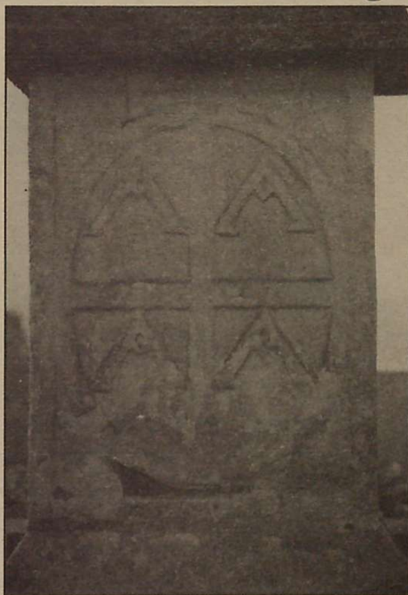
4 IRUDIA: Hendaiako oinarriko atzekaldearen irudia.

Sarako gurutzea Hendaiakoaren sinplifikazioa da, gurutzea —esaldirik gabe— eta Barandiaranen hilarriko irudia izango dena baino ez baitu bertan bildu. Gainontzeko osagaiak bazterturik geratzen dira, bai irudiak baita orientazioa ere. Barandiaranek, gorago aipatu dugun bezala, ezagutzen zuen Hendaiako gurutzea ( Obras Completas , III, 487 orr.), baino ez zen interpretazio-rik ematen ahalegindu. Ez dugu du-darik bere hilarriarentzako irudi hau aukeratzeko (ikus 4 irudia) Sarako gurutzean oinarritu zela eta, beraz, bera-