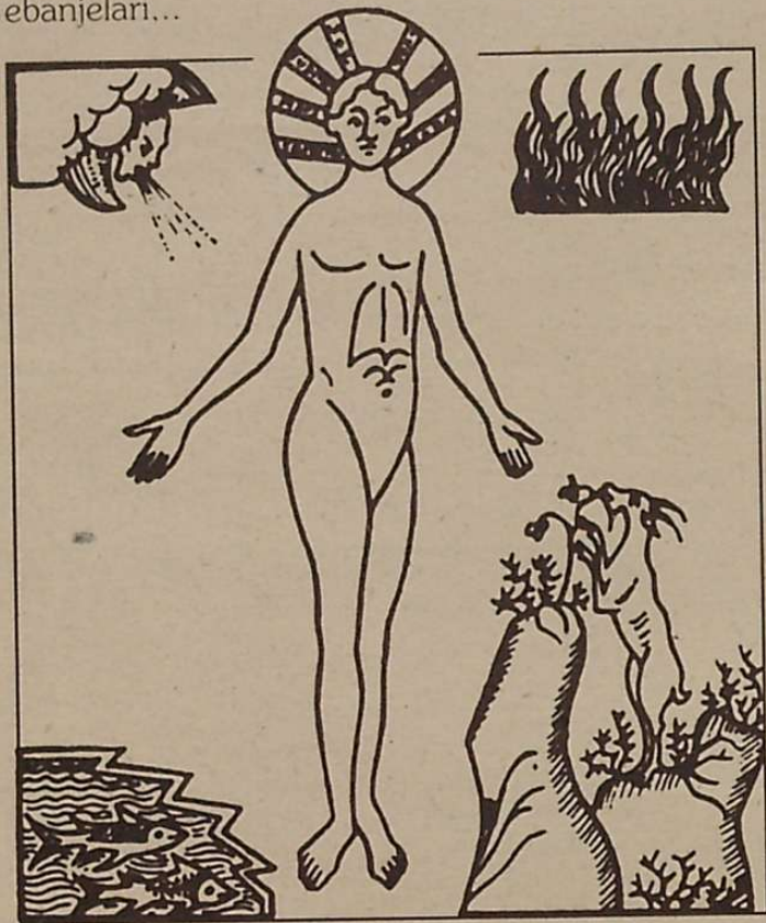
5 IRUDIA: XII. mendeko miniatura Arte alsaziarra.