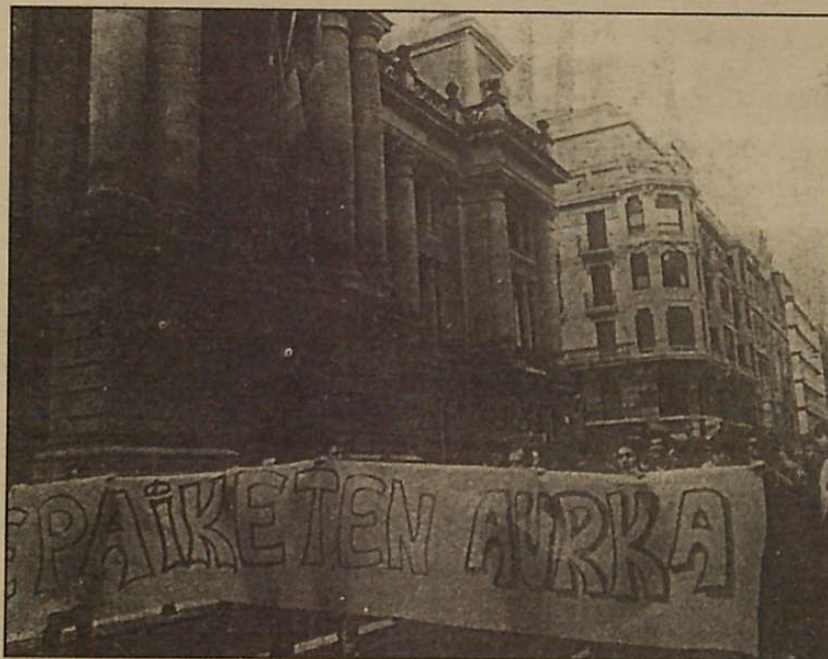
Argi geratu da zein den Euskal Gaztediaren oihua: INTSUMISIOA.

bedientzi zibil zuzen bat ematean datza, soldaduskara edo ordezkora joateko jarritako egunean ez joanez eta era berean, postura publikoa eginez. Lehen atxilotetak hasten dira, epaiketa militarrekin batera. Aldi berean, lehen udal-letxe intsumisoak azaltzen dira, ejerzitoarekin kolaboratu nahi ez dutenak. Intsumisioen aurkako errepresio selektiboa hasten dute militarrek eta Hego Euskal Herrian 15-20