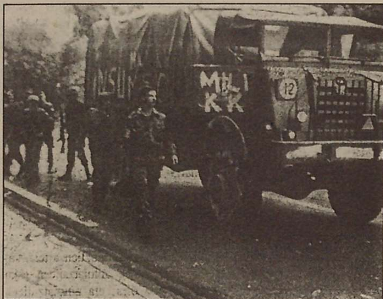
Lezok argi adierazi die Militarrei ez ditugula inguruan ikusi ere egin nahi.

erosteko (gastu militarrek) eta batez ere, gizarte honetan, gazteok soldadutza bete beharra, 17-18 urte betetzean. Hilabeteetan zehar, herritik kanpo, lagunetatik urrundu eta heziketa militar bat eman nahi digute, hau da, burua zuritu. Giza nortasunaren balore arbuigarrienak defendatzea, sumisio osoa agintariei, ez pentsatzea,... Ejerzitoak indarkeria, sexismo matxista, obediencia itsua eta honelako baloreak ezarri nahi dizkigute. Eta hori bizirik irten ezkerro, ze zenbat gaztek galtzen dute bizitza soldaduskari? Zenbaterik jasaten dituzte tratatu txarrak, humilazioak?