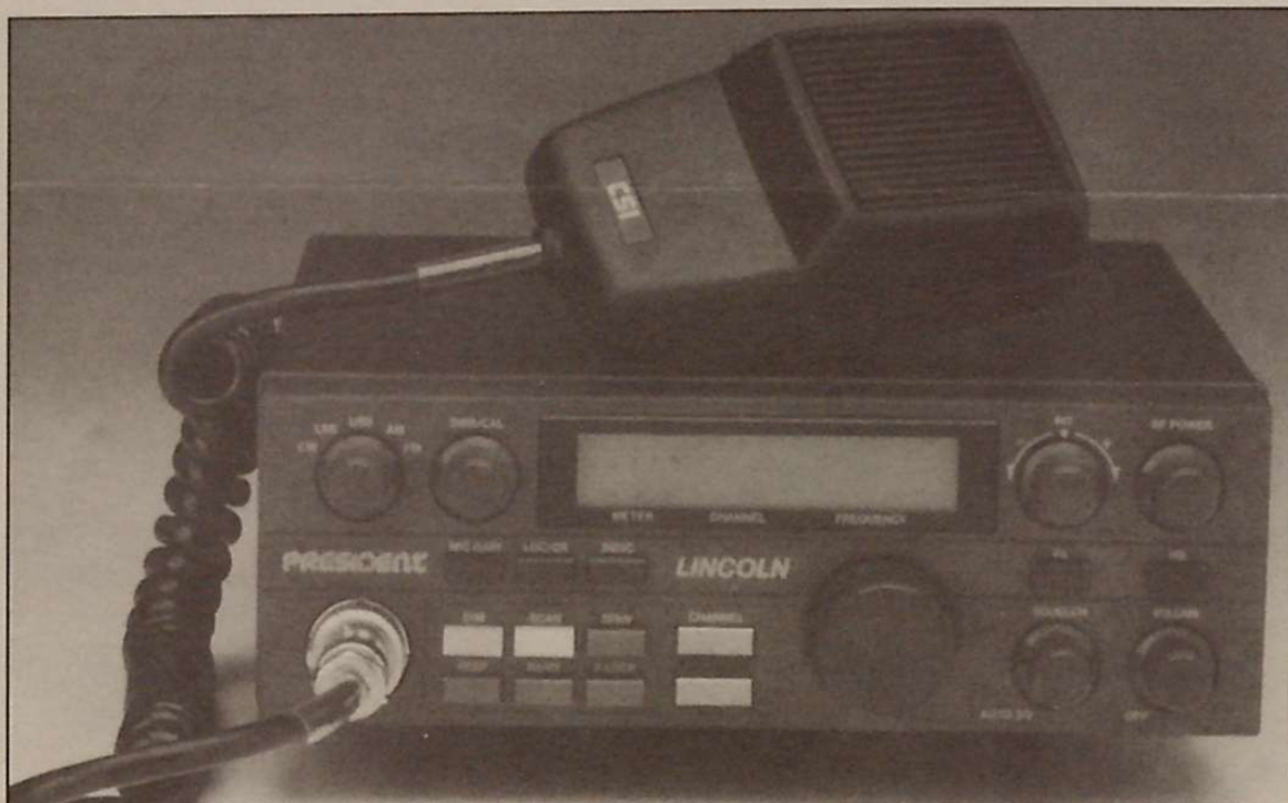
Un equipo de radioaficionado