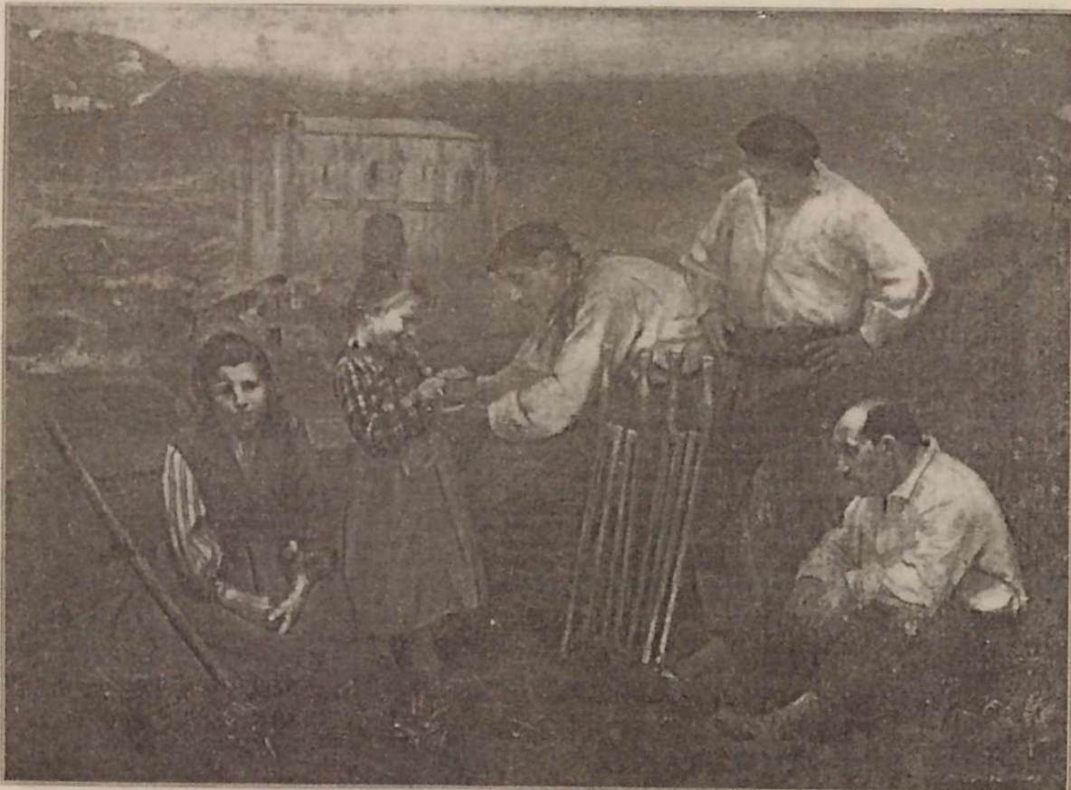
"Laiatzaileak". Elias Salaberriaren koadroa