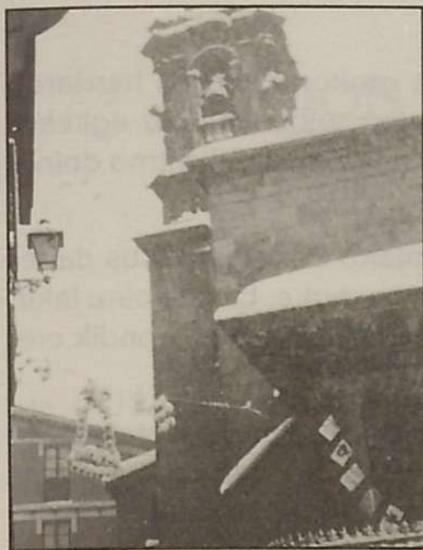
Santo Kristoren basilika elur azpian

Meza Nagusia abesteko doinu berriekin. Ahots bakarrera eta organo laguntzaz emana dago. Lehenengok konpasetik hasi eta partitura guztian zehar, euskal doinu herrikoia gogoratzen duen gai bat darabil, «leitmotiv» gisa, eta tonu modulazioak sartzen ditu aberasgarri.