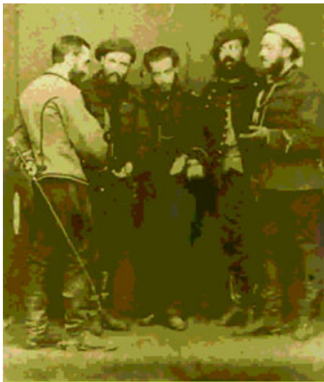
Ofizial karlistak (1873-1876)