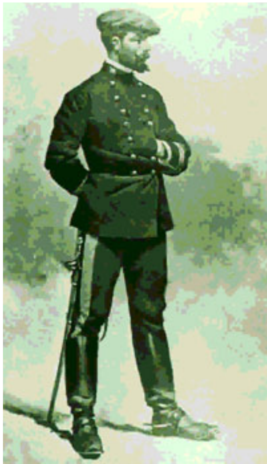
Ofizial karlista (1873-1876)