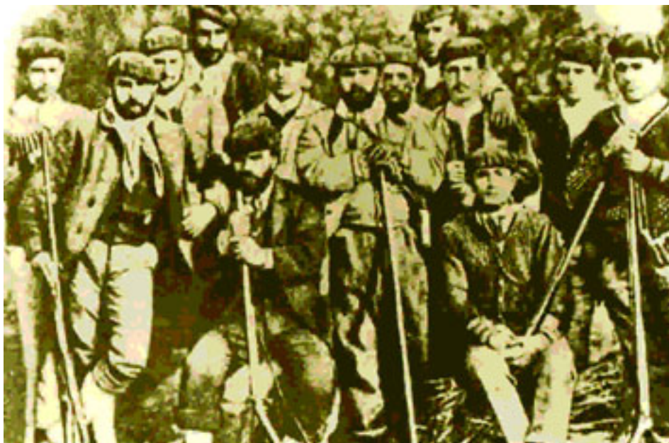
Santa Cruz apaiza eta bere mutilak (1873-1876)