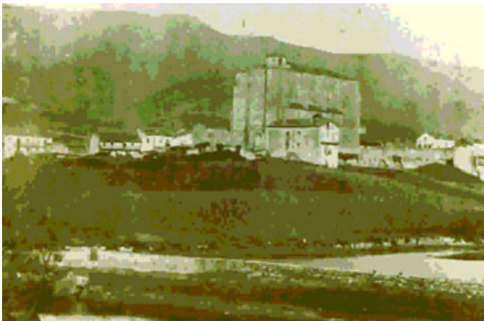
Lezo Pasaiaiko bidetik

agintariak goraiatu zuten bera– aliatu leialak ziren eta orobat historia kolektibo moduko hori pairatzen zuten; izan ere, epaitzen eta exekutatzen zituzten –prozesu sumarioetan, gainera– ikusten zituzten usteko espioiak, oraingoan, logikoa denez, William Pittek iraultza barnetik leherrarazteko bidaliak. 15