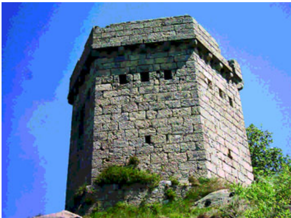
II. gerra karlistako zaintzarako Jaizkibelen dagoen dorreetako bat (1873-1876).