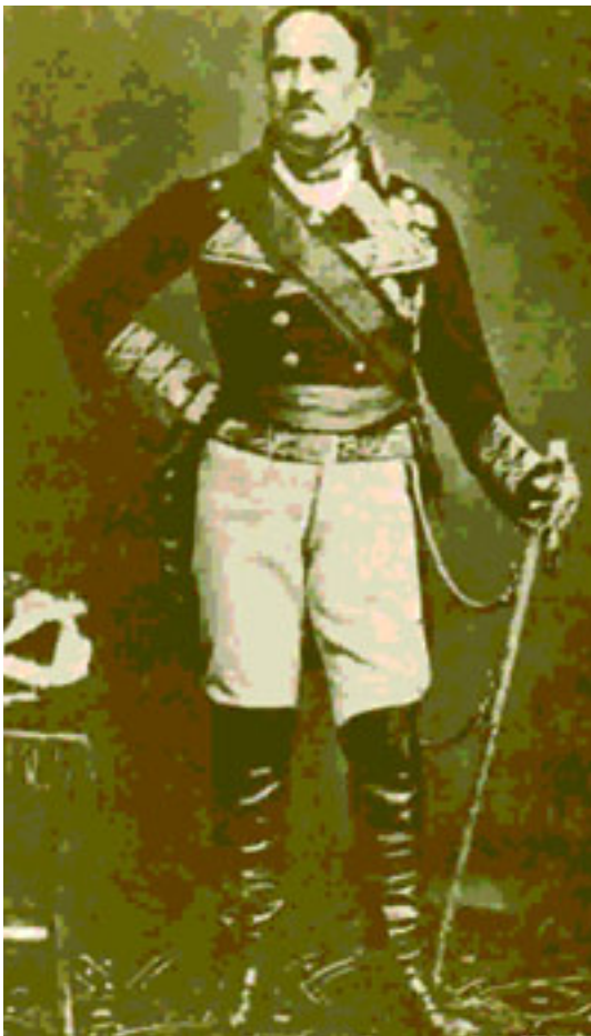
Espartero Generala, 1854. urtearen inguruan