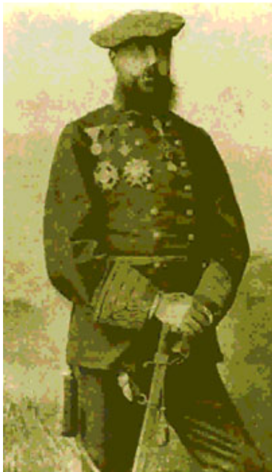
Karlos VII.a Espainiako erregea (1873-1876)