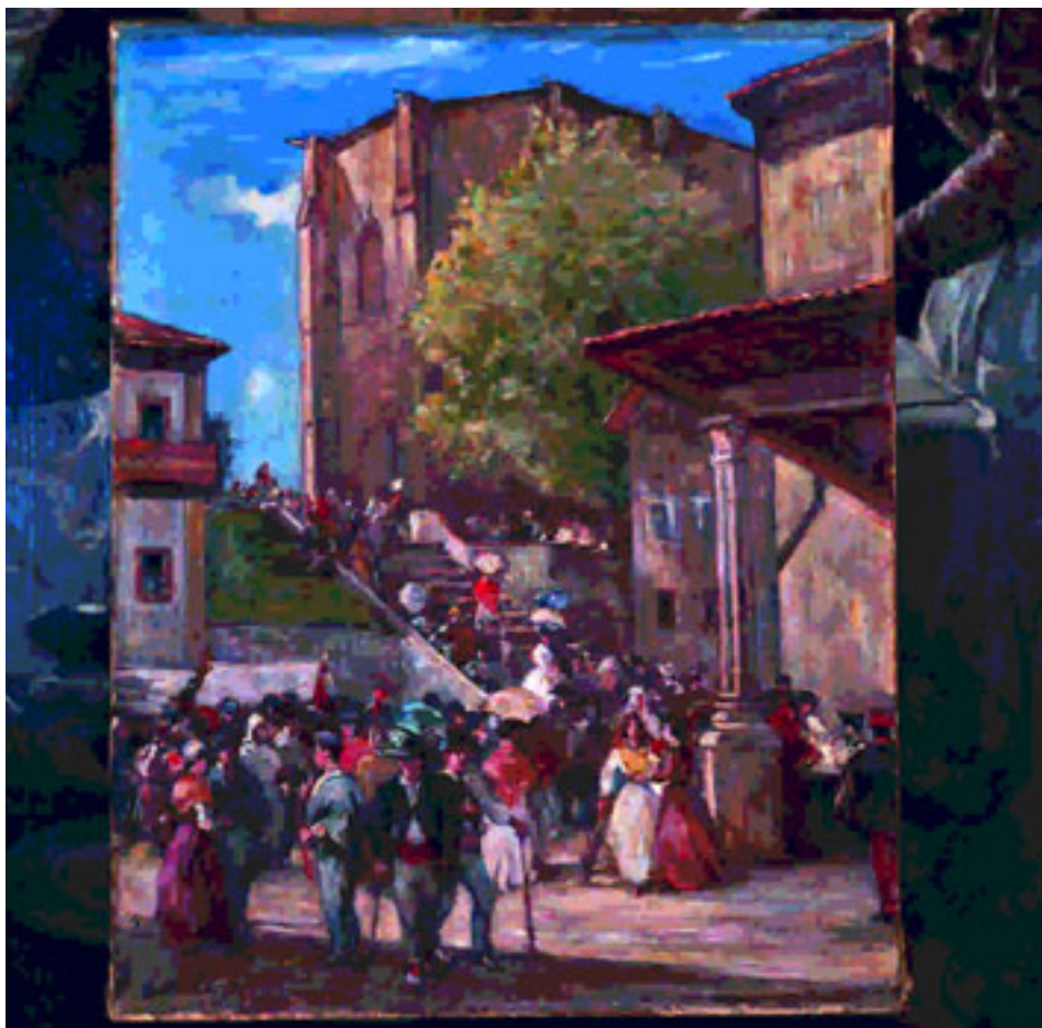
Lezo XIX. mendean

Urte hartako maiatzaren 4an, hura egia zela erakusten zuten udal agiriekin, Fernando VII.aren ahotik irten zen arren; alegia, ez zela zurrumurru hutsa. Aldaketak benetakoak ziren. Lezon, udalbatza berria hautatu zuten. Egia da hitza eta botoa zuten bizilagunak Espiritu Santuaren mezara –Antzinako Erregimenean hain ohikoa– joan zirela aurretik. Garai hartan ohikoa zen elizkizun hura, arazo larrietarako laguntza eskatzeko; gerra kontseilurako, adibidez. Ezin dugu ahaztu, ezta ere, apaizak izaten zirela hautaketa haietan; arrazoiren bategatik, 1812ko liberalismoak ez zion horri uko egin nahi, nahiz eta 1789an Frantzian hasitako iraultza sakona ekarri. 105