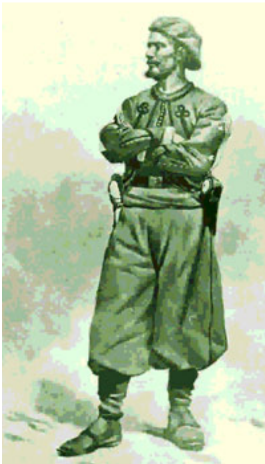
Zuabo soldaduen buru karlista (1873-1876)