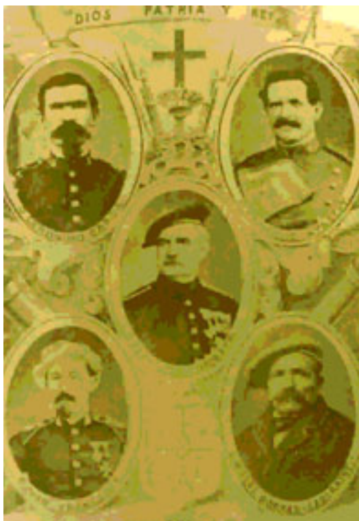
Iragarki karlista (1873-1876)